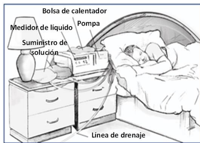
Ciclado continuo diálisis peritoneal